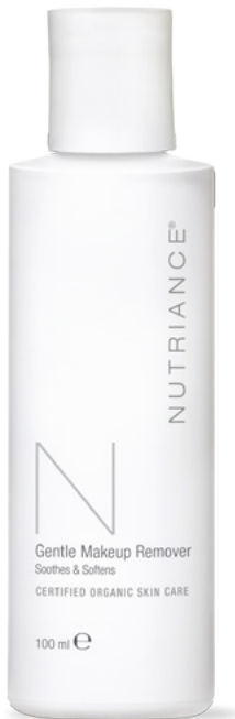
Kodas 363 | 100 ml

Prieš pradėdami naudoti veido odos valiklį, švelniai ir veiksmingai nuvalykite makiažą nuo veido odos ir akių naudodami makiažo valiklį, kuris ramina ir minkština odą. „Nutriance Organic Gentle Makeup Remover“ – tai visiems odos tipams, taip pat ir jautriai odai, tinkanti pažangi formulė, kuri nedirgina odos, jos nebūtina nuplauti.